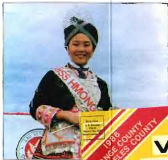
SIAM NKAUJ NI MISS HONG